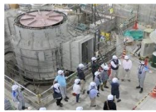
今回のツアーで 見学いただくダム (写真はイメージ)