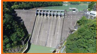
建設時ダム高さ東洋一(S13連開) 登録有形文化財、近代化産業遺産