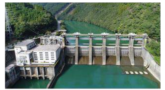
九州初のダム式発電所である大内原 発電所のダム