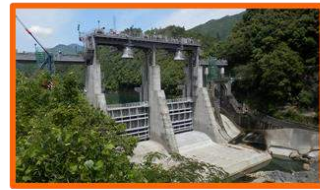
耳川水系で最も古いダム(S4連開) H30.5ダム改造工事完了