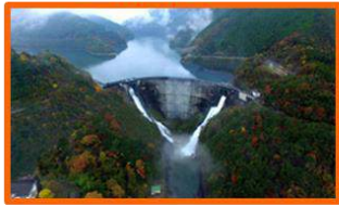
日本初の大規模なアーチ式ダム 日本ダムアワード'2016「放流賞」受賞