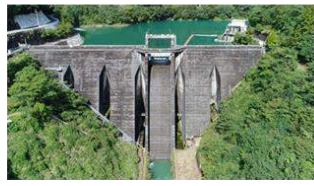
九州唯一(全国で13基のみ)の 中空重力式ダム