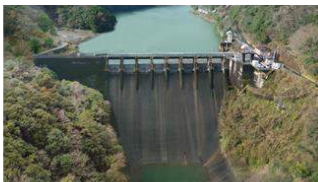
戦時に建設されたダム(S17連開) 塚原ダム建設の技術を継承