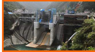
耳川水系で2番目に古いダム(S7連開) 現在、改造工事中(H34.5末連開予定) ラジアルゲートでは日本最大の面積