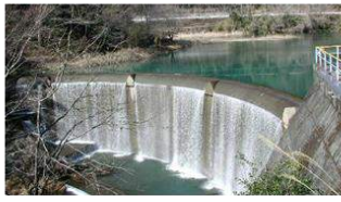
日本で2番目に小さいアーチ式ダム