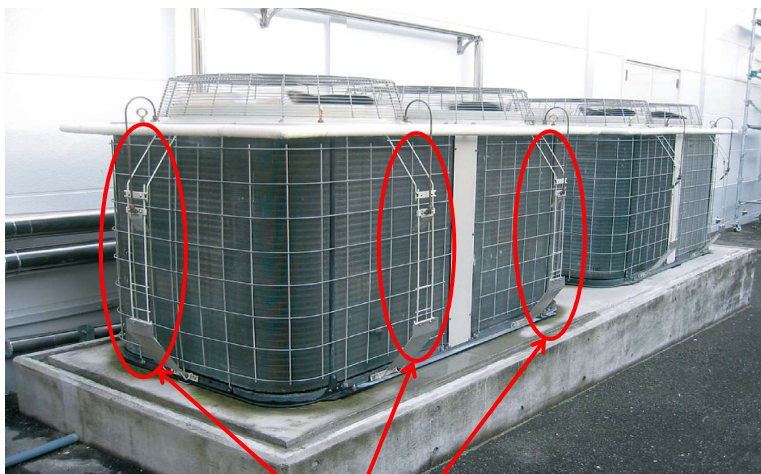
水噴霧装置の設置状況