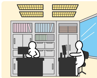
銅鉄型照明器具（従来型）