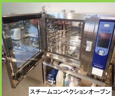
スチームコンベクションオープン