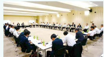
労使懇談会の様子

るため、労使経営委員会や経営専門委員会、労使懇談会等各種懇談会の開催とともに、日頃からコミュニケーションを密にし、情報の共有化を図っています。