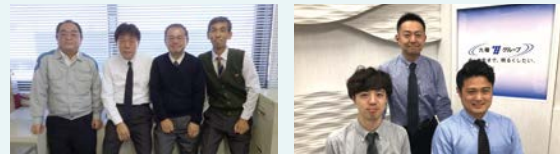
「全社ウォーキングキャンペーン」入賞チーム