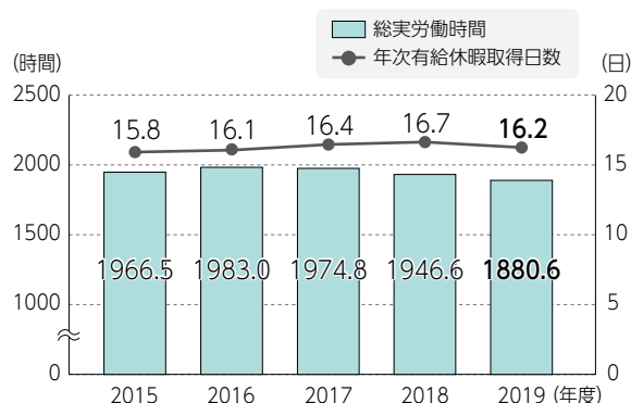
■一人あたりの総実労働時間と年次有給休暇取得日数

また、従業員の心身の健康維持や、労働基準法等の法令遵守の観点から、従業員が使用するパソコンの稼働時間により、労働時間の管理を徹底しています。