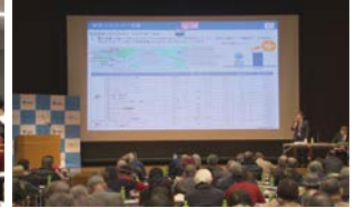
個人投資家説明会