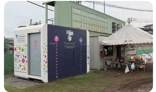
「令和元年九州北部豪雨」の際に被災地に設置した「トワイレ」

水道や電気などのライフラインを必要とせず、汲み取りも不要という特性を活かし、「平成29年九州北部豪雨」「平成30年7月豪雨(西日本豪雨)」「令和元年九州北部豪雨」の際には、被災地の復旧支援として貸出しを行い、多くの方にご利用いただきました。