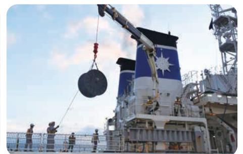
第十管区巡視船「さつま」への資機材積み込みの様子