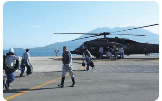
陸上自衛隊による復旧要員の輸送