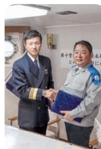
協定締結式の様子

この協定締結により、離島などへの復旧要員・資機材の輸送や、第十管区海上保安本部の施設・活動拠点への電源供給などが可能となり、災害時の双方の活動が迅速かつ円滑に行えるようになりました。