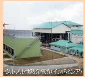
ウルブル地熱発電所(インドネシア)

国内で培った経験と最新技術を活かして、海外での地熱発電開発の支援に積極的に参画(*) (*)インドネシア、コスタリカ、ニカラグア、ケニア、エチオピアなどで支援を実施