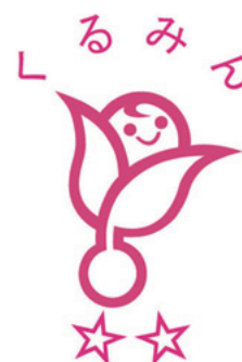
「次世代育成支援対策推進法」に基づく 厚生労働大臣認定マーク(愛称:「くるみん」)

今後も、制度を利用しやすい環境の整備などを通して、社員の働きがいや安心感の醸成、生き活きとした職場環境をつくっていきます。