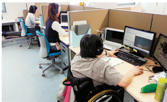
(株)九州字幕放送共同制作センター

また、障がいのある方も、地域・社会の中で活躍できる社会づくりに貢献するため、グループ一体となって、障がい者の雇用促進に努めています。ローカルテレビ局が制作する番組への字幕制作を行っているグループ会社の(株)九州字幕放送共同制作センターでは、字幕の制作に際し、障がい者の方々をスタッフとして採用しています。