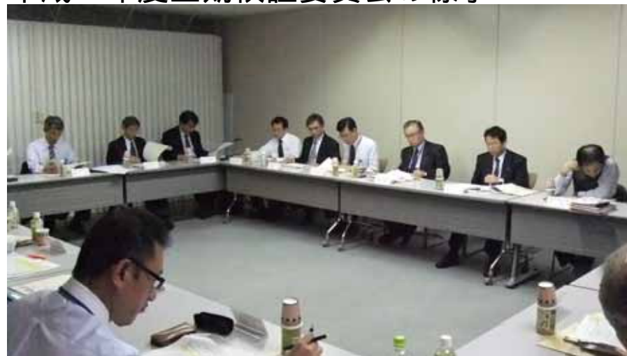
平成24年度上期検証委員会の様子