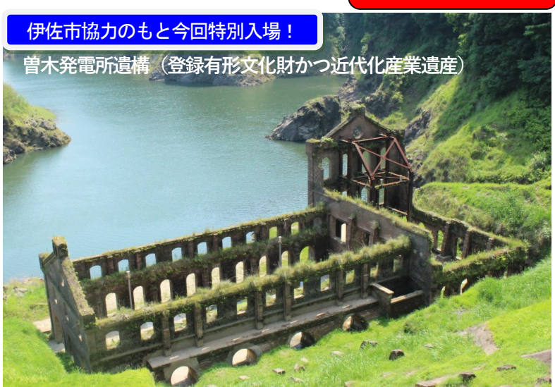
曾木発電所遺構（登録有形文化財かつ近代化産業遺産）