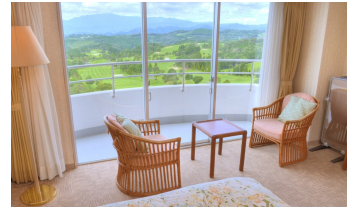
（さつまゴルフリゾート）