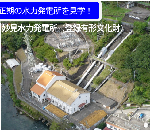
妙見水力発電所（登録有形文化財）