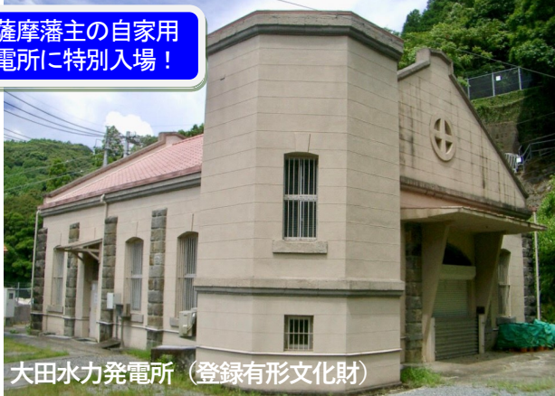
大田水力発電所（登録有形文化財）