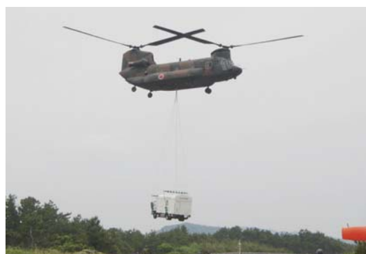
▲福岡県・福岡市合同総合防災訓練における 高圧発電機車空輸訓練

また、自衛隊の大型ヘリコプターによる発電機車の空輸など、自衛隊と連携した訓練を重ね、停電地区が孤立した場合もライフラインの迅速な復旧ができるよう努めています。