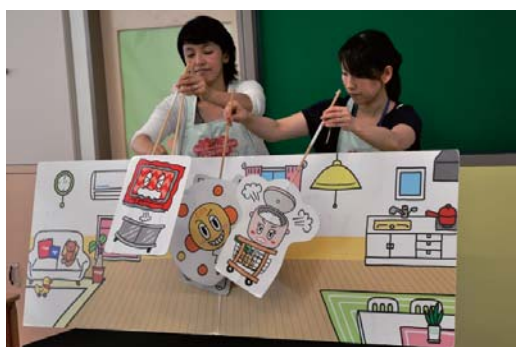
エコ・マザー活動