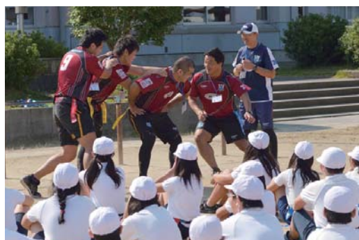
小学校の体育授業におけるタグラグビー教室（福岡県田川郡）