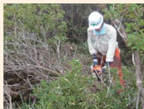
ノリウツギ等伐採の様子