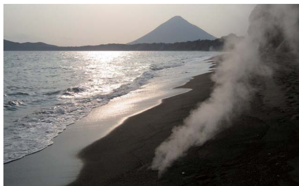
地熱資源の豊かな指宿市

今後も、こうした地域振興策の検討・提案を行うなど、地域に対し積極的に協力していきます。