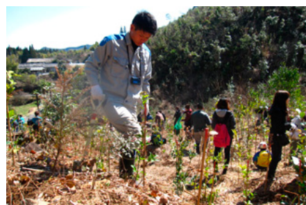
九州ふるさとの森づくり「九電の森ひとよし」(熊本)