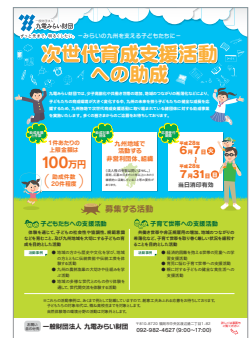
助成団体募集チラシ

共働き世帯や非正規雇用の増加、地域のつながりの希薄化など、子育て世帯を取り巻く厳しい状況を緩和することを目的とした活動