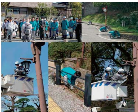
太宰府市国博通り街路灯清掃(福岡南配電事業所)

九州各地において、高所作業車を使って、城壁や神社の鳥居、地域の街路灯など、普段は手の届かない場所の清掃活動を行っています。