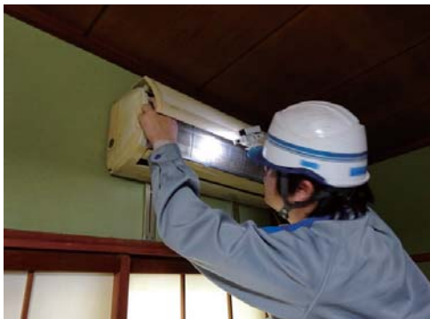
独居高齢者宅の電気設備点検(八幡配電事業所)

九州各地において、地域の社会福祉協議会や電気工事事業協同組合、教育委員会等の皆さまとの協働により、重要文化財や独り暮らしの高齢者の方の配線診断を実施しています。