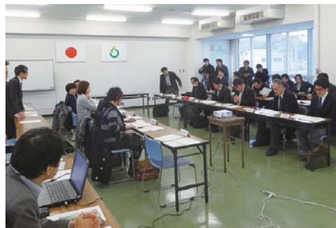
まちづくり委員会会合

同提言書は、2016年3月にまちづくり委員会から市へ提出され、計画実現に向けた方針書として位置付けられています。