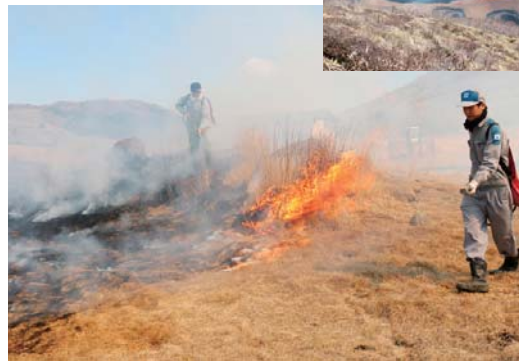
坊ガツル湿原の野焼き