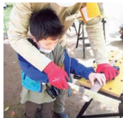
「きゅうでんプレイフォレスト」の様子(福岡県北九州市)