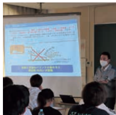
高校生を対象とした出前授業の様子(熊本県熊本市)

子どもたちへ、環境に関する様々な「学び」や「体験」の場を提供し、自然を大切にすることを育みます。