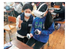
デジタル環境教育の様子(福岡県福岡市)

九州電力(株)の社有林「くじゅう九電の森」で行う環境教育がデジタル技術の活用により、各学校でも体験いただけます。VRを活用した間伐体験や、学校とくじゅう九電の森を繋ぐオンラインライブ等、デジタルならではのコンテンツです。今後、九州各県での実施を予定しています。