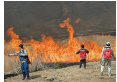
害虫を駆除し、植物の芽吹きを促す目的で実施する「野焼き」