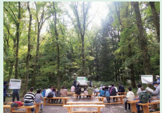
社有林「くじゅう九電の森」での親子向け環境教育イベント (大分県由布市)

「ゼロの先へ。今日の私を変える未来」というスローガンのもとに、九電グループ社員が、地域の生活者の一員として家庭等で取り組む省エネ・電化の取組みについて宣言します。その宣言等をホームページやSNSで地域・社会の皆さまへ広く発信・共有し、九州地域の脱炭素に向けた機運醸成に貢献していきます。