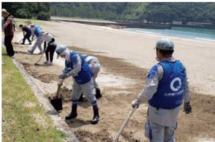
海岸における清掃活動(宮崎県宮崎市)