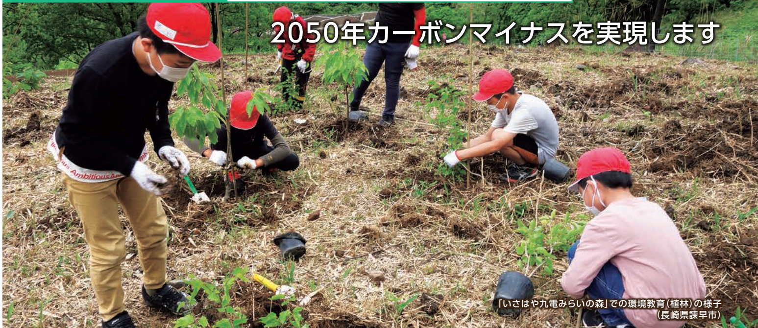
【いさはや九電みらいの森】での環境教育(植林)の様子 (長崎県諫早市)