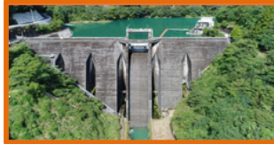
九州唯一(全国で13基のみ)の 中空重力式ダム