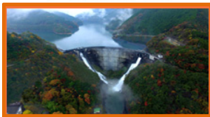
日本初の本格的アーチ式ダム 日本ダムアワード2016「放流賞」受賞