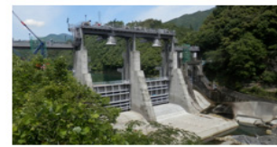
耳川水系で最も古いダム(S4運開) H30.6ダム通砂対策工事完了予定 吊鐘状のクレーンカバーが特徴