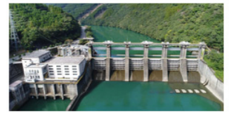
九州初のダム式発電所である大内原 発電所のダム