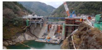
改造工事中 (H34.5末運開予定) H30.5～12にラジアルゲートで日本 最大のゲート面積の洪水吐ゲートを設置