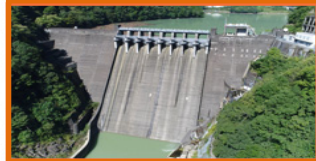
建設時ダム高さ東洋一(S13運開) 登録有形文化財、近代化産業遺産