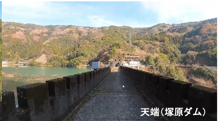
耳川ダムロード応援隊