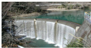
日本で2番目に小さいアーチ式ダム