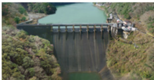
戦時中に建設されたダム(S17運開) 塚原ダム建設の技術を継承