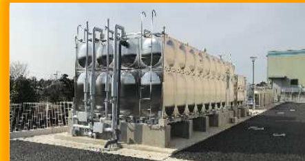
開放型貯水タンク