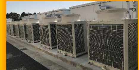
エコキュート室外機