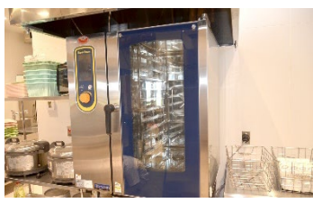
蒸し料理も可能な スチームコンベクションオープン