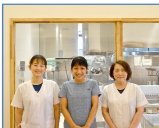
厨房スタッフの皆さん

電化厨房は、火を使わないため、安全だけでなく、鍋の周りの放熱も少ないので以前の職場と比べると夏の暑さも変わりました。また、電化厨房は想像以上に火力も強く、電気式スチコンは焼きムラも少なく、調理時間が鍋釜だけの調理に比べ半分くらいになりました。ブラストチラーもつけてもらいましたが、夏は冷たい和え物やサラダも提供できるようになり、シャキシャキとした触感も残しつつ、食中毒防止にもつながりました。安心・安全・効率化を図れる電化厨房を導入してよかったと実感しています。