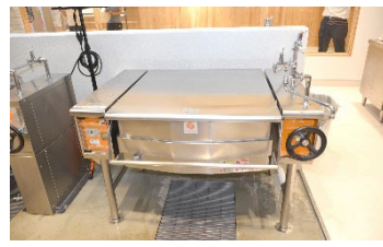
色々な料理に使える電気式 ブレイジングパン