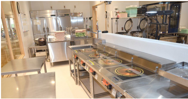
いつでも清潔な厨房環境を保っています