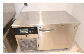
天板を作業台としても使える プラスチックラー