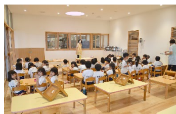
厨房は園児からも見えるように ガラス張りになっています