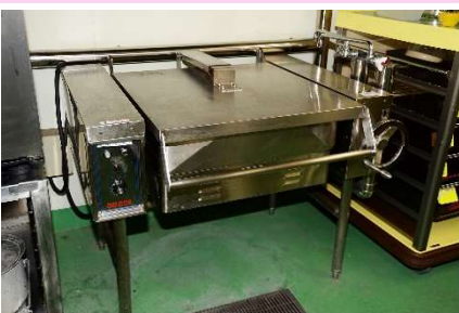
ハイパワーで使い勝手が良いIH調理器