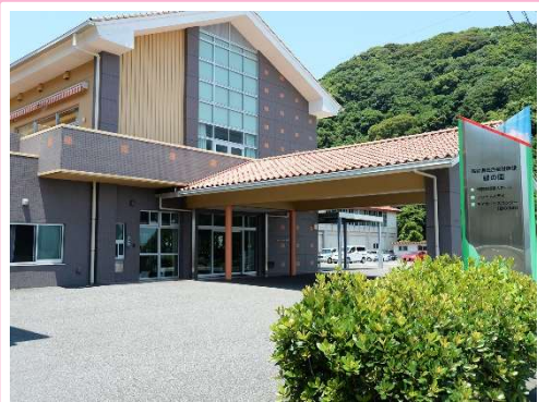
高齢者総合福祉施設 緑の園 玄関

緑の園は、特別養護老人ホーム、ショートステイセンター、デイサービスセンターなどを併設した高齢者総合福祉施設で、昭和48年に設立し、平成23年に臼杵湾を望む現在の地に移転しました。