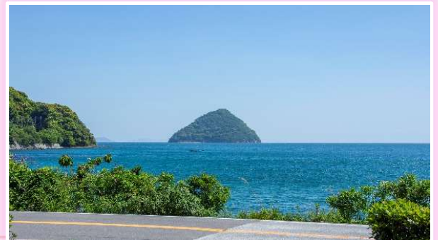
施設の前に広がる白杵湾