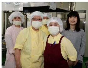
栄養士さん、調理担当のみなさん