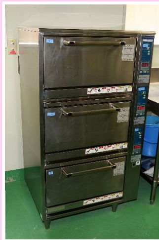
熱効率が高く、かまど焚きのご飯やお粥も炊き分ける立体炊飯器