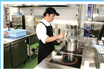
吹きこぼれても拭き掃除で簡単にきれいになるIHコンロ