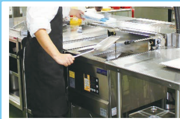
油汚れの付着が少なく、清掃がしやすい電気フライヤー