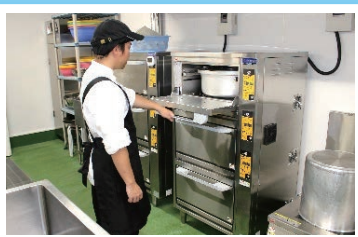
操作性がよく、不完全燃焼の心配がない電気自動炊飯器