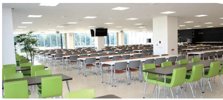
気持ちよく食事や会話が楽しめる、明るく、開放的な社員食堂