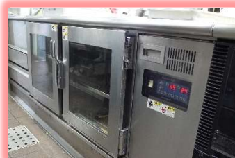
作った料理の品質をハイレベルでキープできる電気湿温蔵庫