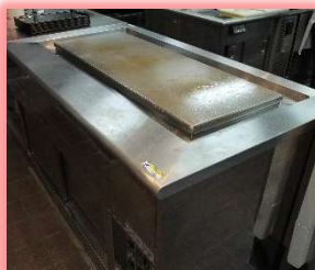
ステーキを焼くのに最適なグリドル