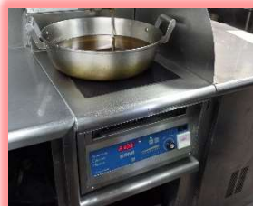
ハイパワーな電気天ぷらフライヤー