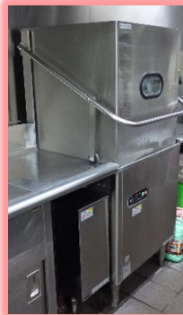
後片付けがスムーズになる食器洗浄機