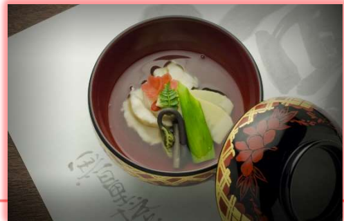
(碗) 鮎並の花びら碗(筍、ウレイ、木の葉)