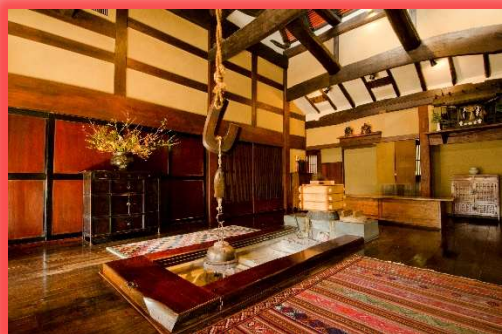
茶寮 柴扉洞 (SAIHIDO)

ホームページアドレス http://www.sansou-murata.com/