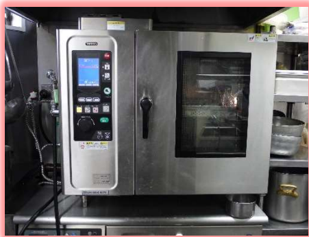
焼く・煮る・蒸すも簡単なスチームコンベクションオープン