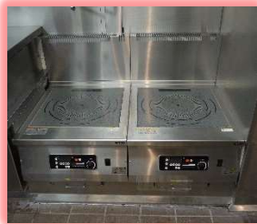
大きく深さのある鍋でも調理しやすいIHローレンジ