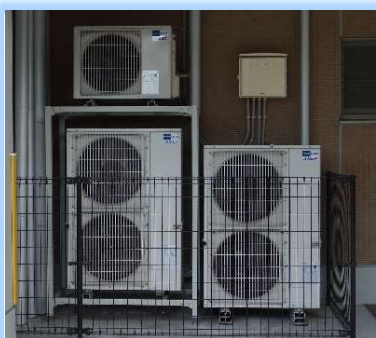
空調（左写真）や給湯（右写真）も電気式を採用した「オール電化園」