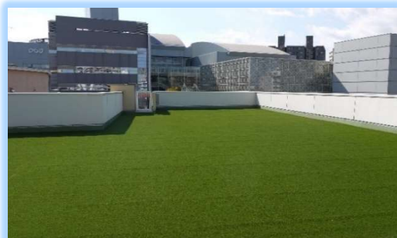
当園は町中にあり園庭が広く取れないため、園舎屋上 にふっかふかの人工芝広場を設置 （後方は大分県立美術館OPAM）