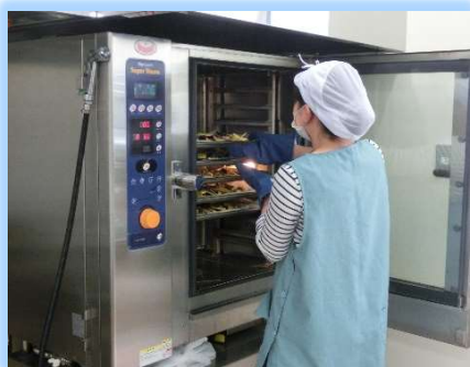
焼く・煮る・蒸すも簡単なスチーム コンベクションオープン