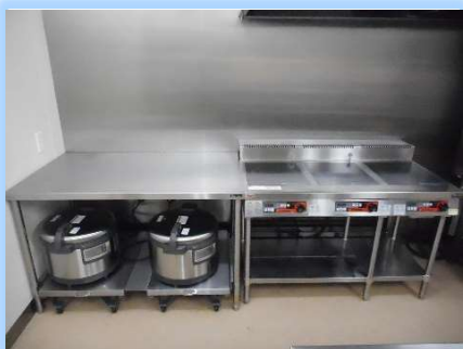
熱効率が良く、直火を使わない ので周囲が暑くならない IH炊飯器（左）とIH調理器（右）