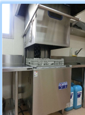
自動食器洗浄機で後片付けも スムーズ