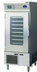
リヒートウオーマ キャビネット