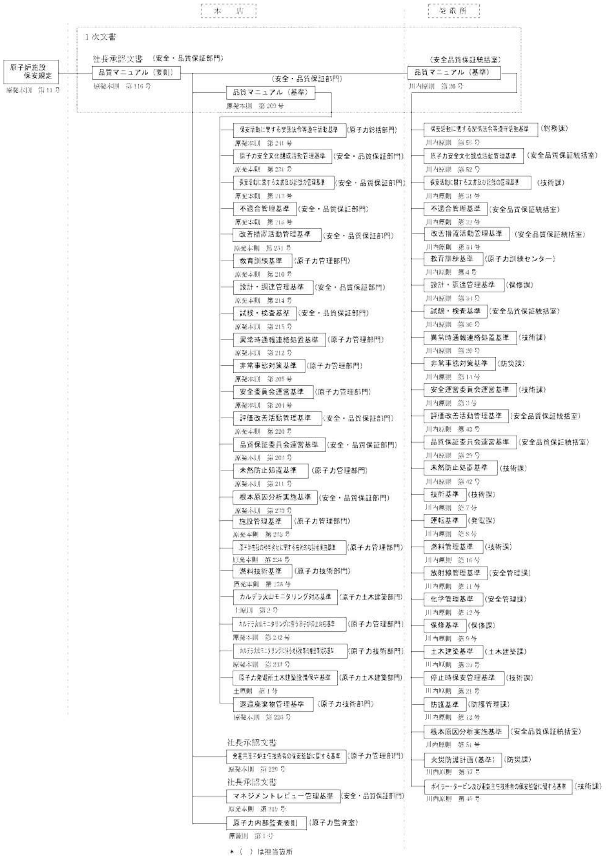
第1.17-1図 品質マネジメントシステム計画に係る規定文書体系図