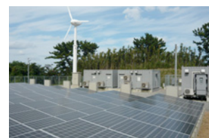
黒島の実証試験設備(鹿児島県)