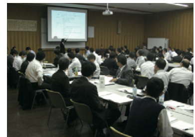
内部環境監査員養成研修

事業所のEMS運用支援や、環境管理責任者及び事業所EMS事務局を対象としたEMS専門研修等により、EMS運用レベルの継続的な向上を図っています。