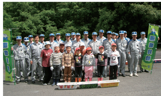
プランタの設置と清掃活動に参加された皆さま