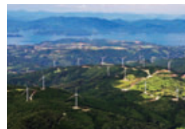
長島ウインドヒル(株) 長島風力発電所(風力)

国産エネルギー有効活用の観点から、また、地球温暖化対策面で優れた電源であることから、グループ一体となった開発や電力購入を通じて導入拡大に取り組んでいます。