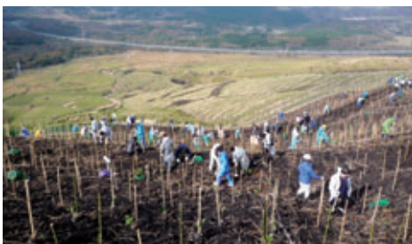
九州ふるさとの森づくり(大分県由布市)