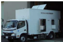
高圧発電機車の整備

さらに、更なる安全性・信頼性の向上に向け、「免震重要棟」などの基本設計に着手しました。