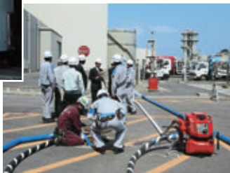
仮設ポンプによる冷却水供給訓練