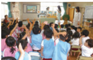
エコ・マザー活動 かすみ保育園(鹿児島県鹿児島市)

2001年からの10年間で100万本の植樹を達成した「九州ふるさとの森づくり」や、保育園等で環境紙芝居の読み聞かせなどを行う「エコ・マザー活動」など、地域の皆さまと一体となった環境活動に取り組んでいます。