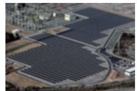
メガソーラー大牟田発電所(太陽光)