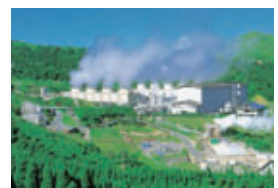
八丁原発電所(地熱)