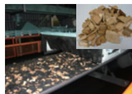
峇北発電所 石炭と混ぜられた木質チップ(粉碎前)