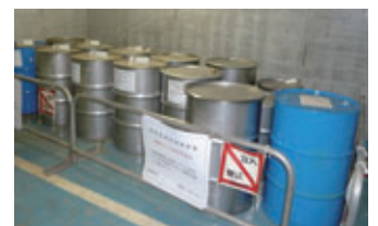
PCB廃棄物の保管・管理状況

その他の取組みについては九州電力ホームページ 関連・詳細情報 (P2参照) > ダイオキシン類