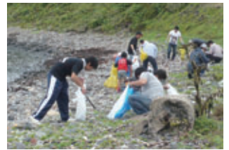
清掃活動 (吉岐営業所)

事業所周辺の道路や公園、海岸などの清掃活動を67事業所で実施し、地元自治体等主催の清掃活動にも19事業所が参加しました。