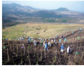
九州ふるさとの森づくり(大分県由布市)

2011年度以降についても、低炭素社会実現への寄与や生物多様性の保全を目的に、引き続き「九州ふるさとの森づくり」を展開しています。2011年度は、約7千名の皆さまのご協力により、34か所で約4万8千本の植樹や育林活動(下草刈)を実施しました。