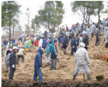
九州ふるさとの森づくり in 大町町IV (佐賀県杵島郡)

また、より早く、その土地本来の森が形成されるように、密植(1m 2 あたり2~3本程度植樹)・混植(複数の樹種の組み合わせ)を基本とする植樹に取り組んでいます。この方法を採用した植樹地の多くが、密植・混植を行わなかった箇所以上の生育を見せており、年を経るにつれ、その効果が現れています。