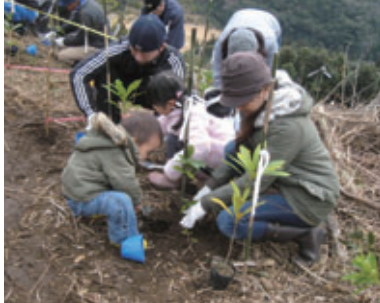
花立ふるさとの森づくり (宮崎県日南市)

その土地本来の森は、豊かな生物多様性を維持し、水源涵養、土砂災害の防止、保健休養の場の提供など、様々な公益的機能を果たしています。「九州ふるさとの森づくり」では、将来的に人の手があまりかからない、九州の自然植生であるシイ・タブ・カシ類を中心とした、その土地本来の樹種による森づくりを行っています。