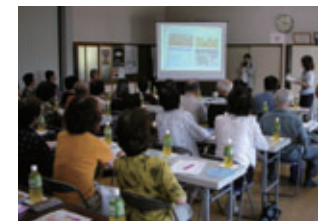
講演会 (人吉営業所)

省エネルギーなどの環境問題について、地域の自治会などを対象に3事業所で講演会・研修を実施しました。