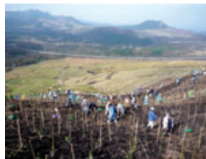
九州ふるさとの森づくり(大分県由布市)

2011年度以降についても、低炭素社会実現への寄与や生物多様性の保全を目的に、引き続き「九州ふるさとの森づくり」を展開しています。2011年度は、約7千名の皆さまのご協力により、34か所で約4万8千本の植樹や育林活動(下草刈)を実施しました。