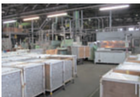
リサイクル処理工場