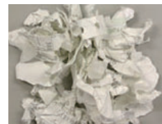
破碎処理した文書類