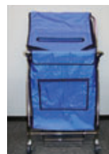
機密文書専用回収ボックス