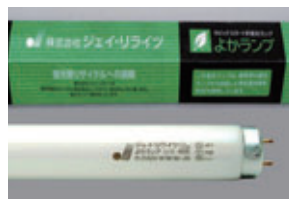
リサイクル蛍光管“よかランプ”