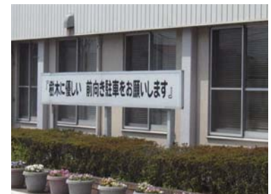
「前向き駐車」呼びかけ看板