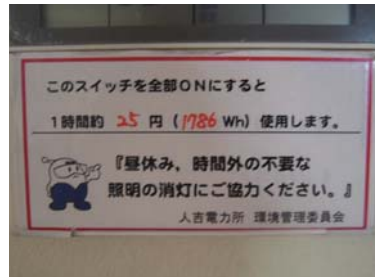
スイッチ部の標識

また、当電力所では環境にやさしい行動の一環として「樹木に優しい前向き駐車」にも取り組んでおり、お客さま用駐車場に呼びかけ看板を設置し、協力していただいています。