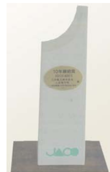
株式会社日本環境認証機構より受領した「10年継続賞」 (2011年3月)

当電力所は、環境管理システムの国際規格であるISO14001の認証を取得し、2012年3月で11年間の継続となりました。