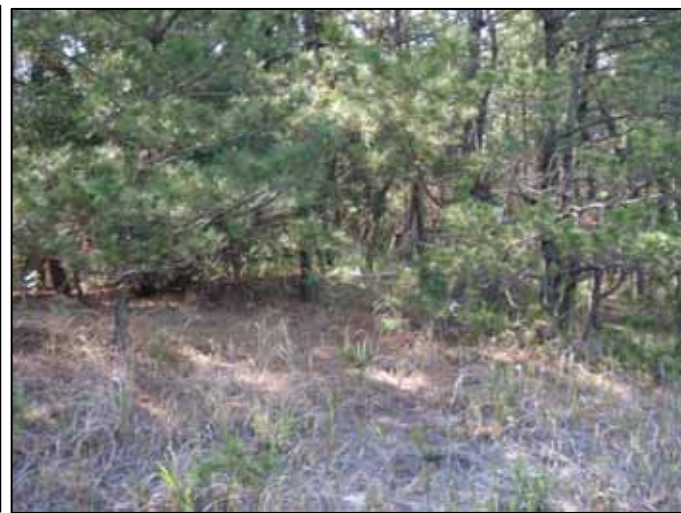
[ショウロの生育が確認された場所]