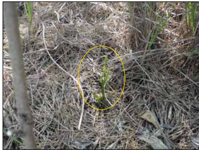
[シュンラン(動物による食害痕跡あり)]

環境省レッドリスト：環境省が選定した絶滅のおそれのある種のリストのこと。リストは専門家による検討を踏まえ、絶滅の危険性を評価して作成される。 レッドデータブック：絶滅のおそれのある野生生物の情報を取りまとめた本。環境省版のほか、都道府県版も作成されている。鹿児島県版は平成15年3月発行。