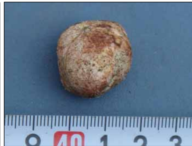
[確認したショウロ]