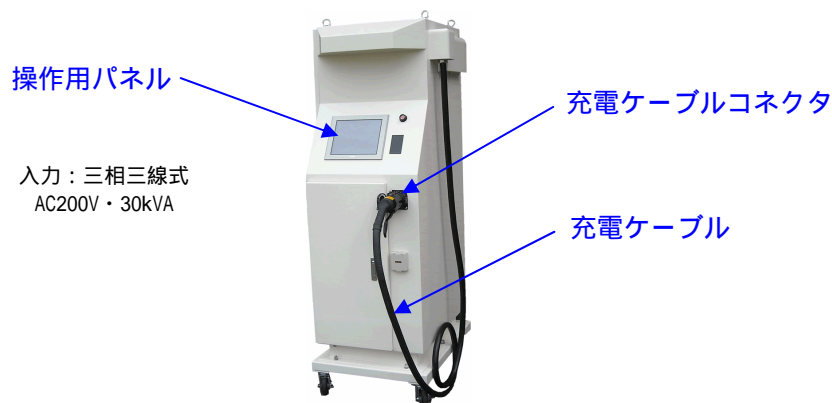
直流電源とスタンドを一体化