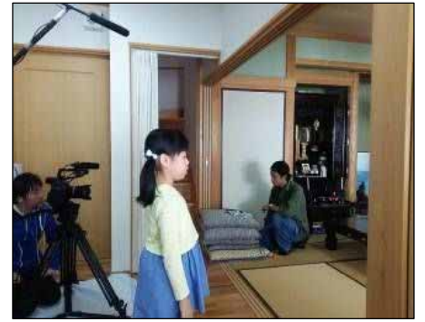
おばあちゃんのホットケーキ