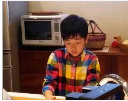
初めての夕ごはん