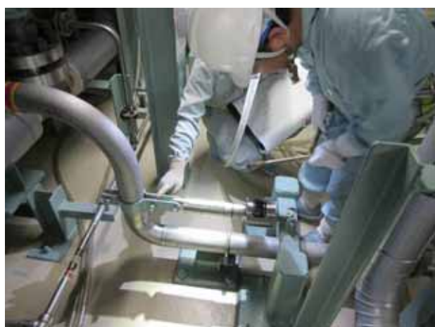
配管の支持装置点検