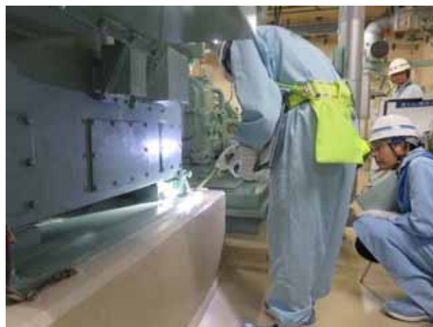
ポンプの基礎ボルト点検