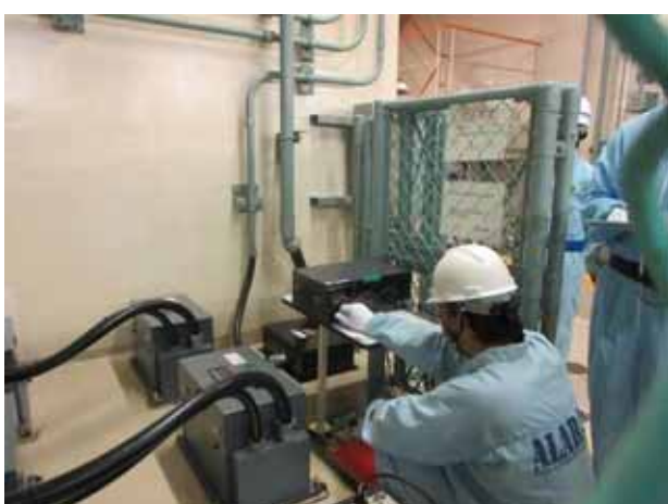
原子炉停止用地震計点検