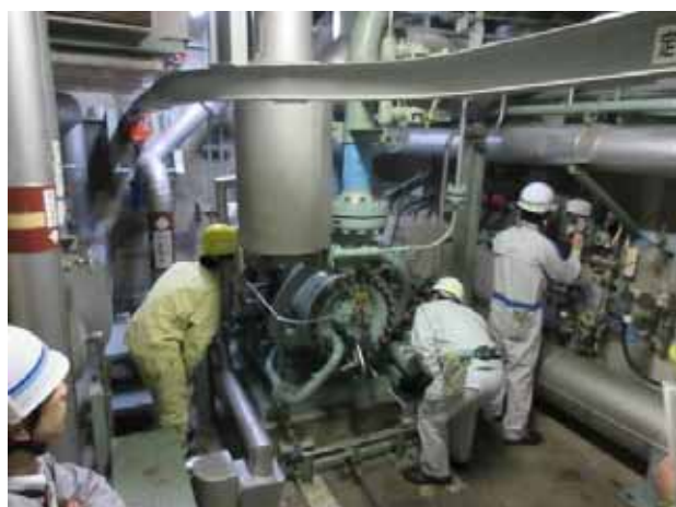
タービン動補助給水ポンプ作動試験