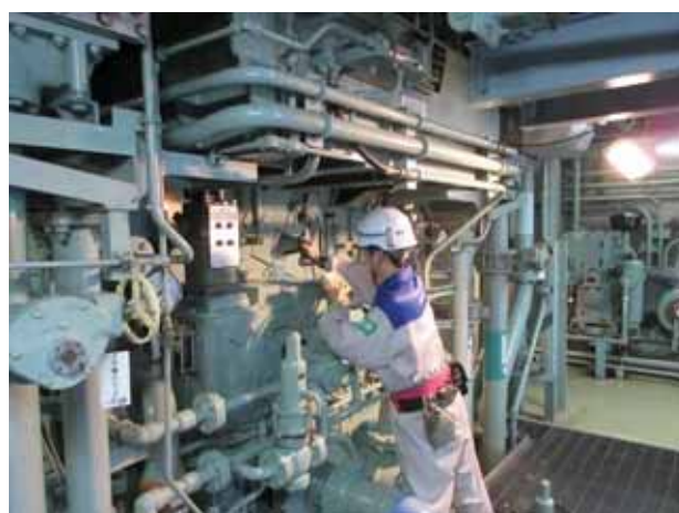
非常用ディーゼル発電機作動試験