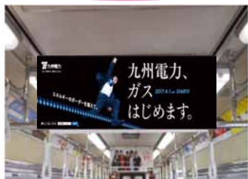
地下鉄中吊り(空港線・七隈線・箱崎線) JR中吊り(鹿児島本線・筑肥線・福北ゆたか線)