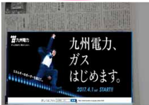
福岡・北九州エリア (全国紙・地方紙)