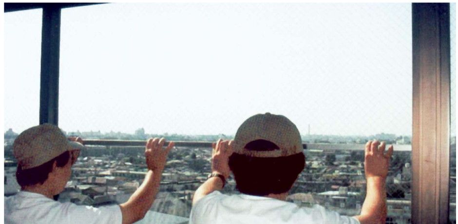
断熱対策実施風景