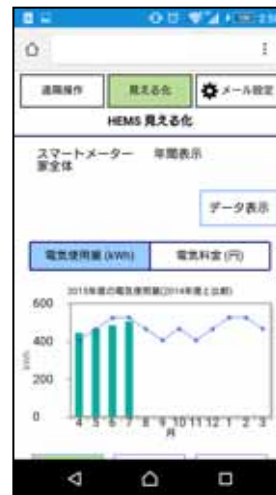
[図2 電気使用量グラフ化]

ご家庭の電気使用量の目標値を設定でき、リアルタイムに現在の使用量と比較できます。