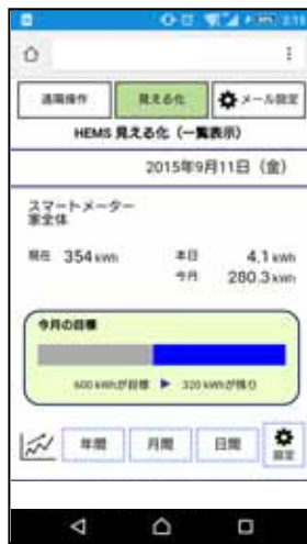
[図1 目標値との比較]

ご家庭の電気使用量の目標値を設定でき、リアルタイムに現在の使用量と比較できます。