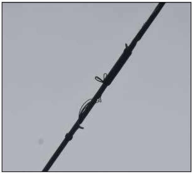
(損傷状況) 素線切れ4本