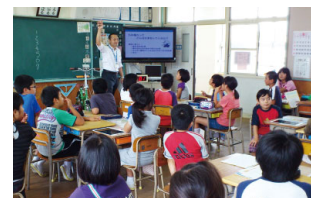
出前授業 小・中学生を対象に、当社社員等が講師となってエネルギーに関する授業を実施。 2013年度実績：計343回、約12,741名