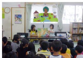
エコ・マザー活動 九州各地で地域のお母さま方が「エコ・マザー」として保育園などを訪問し、環境紙芝居の読み聞かせなどを実施。 2013年度実績：計250回、約18,717名

九州の子どもたちに、エネルギー・環境や文化・芸術等に関する学びや出会いの場を提供し、子どもたちの好奇心を刺激するとともに、感性を豊かにすることを目的に、九州各地で様々な活動を展開しています。