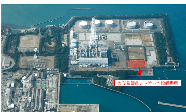
大容量蓄電システムの設置場所