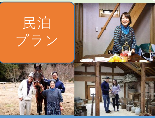
一軒家に宿泊し菊池の自然と手作り料理を五感で堪能