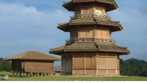
国史跡である日本最南端の古代山城