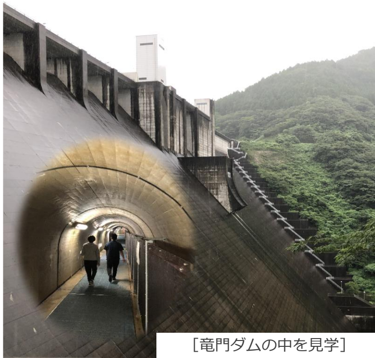
[竜門ダムの中を見学]