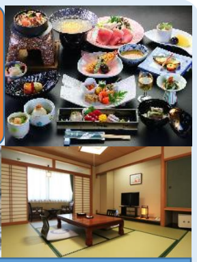
日本名湯百選に選ばれた「美人の湯」と絶品料理を堪能