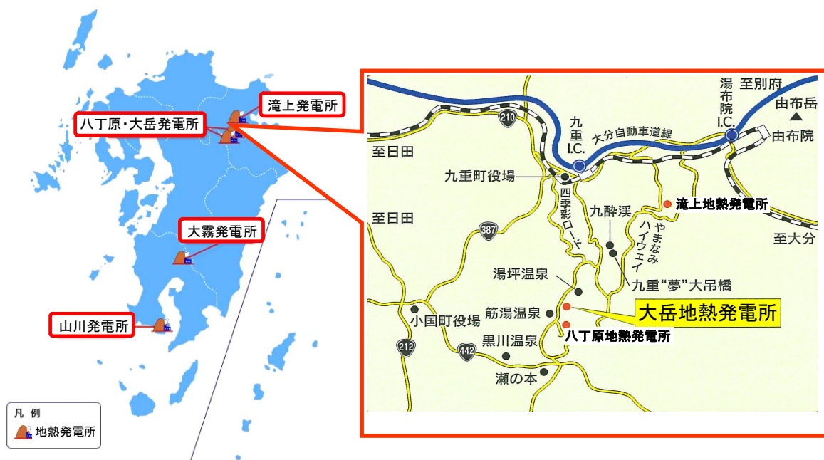
【参考：現在の大岳地熱発電所】