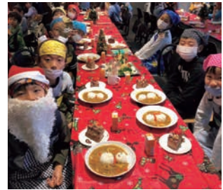
社屋のイベントスペースにおけるイベントの様子(熊本県熊本市)

九州電力(株)は、社屋のスペースを地域の皆さまの憩いの場として活用いただけるよう、カフェを併設したイベントスペースやIHキッチンスタジオを整備し、「子ども食堂」など、各種イベントを開催しています。