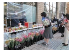
花の購入を通じて生産者の皆さまを支援する活動(大分県大分市)