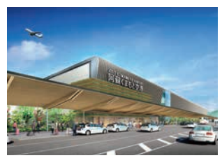
熊本空港新ターミナルビル(2023年春供用開始予定)