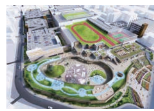
「福岡市青果市場跡地開発」外観イメージ(2022年春開業予定)

九州電力(株)は、他企業とも連携しながら、都市開発事業や空港運営事業などを通じた地域活性化に取り組んでいます。福岡市青果市場跡地活用事業では、地域の賑わいを生み出す大型複合施設の開業(2022年春予定)に向け、準備を進めています。また、空港運営事業では、福岡、熊本、広島空港の運営権を取得し、運営を通じて空港が新たな賑わいの拠点となるような様々な取組みを行っていきます。