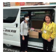
NPO法人への食料品の寄贈(福岡県北九州市)

新型コロナウイルス感染症による影響が長期化する中、地域のさまざまな課題の解決に向け地域の皆さまとともに取り組み、助け合いの輪を広げていく「あしたプロジェクト～あしたを、しんじて、たすけあおう」を実施し、医療従事者や事業者等の支援活動に取り組んでいます。