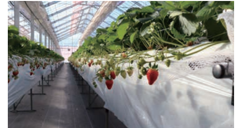
いちご栽培ハウス内

この施設では、これまで培ってきた「農業電化」や「養液栽培」などに関する技術やノウハウを活用し、「よつぼし」など人気品種の栽培を通じて、農家の皆さまの生産性向上や農業振興に取り組んでいます。