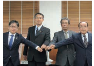
相島活性化協議会との協定締結時の様子(福岡県新宮町)