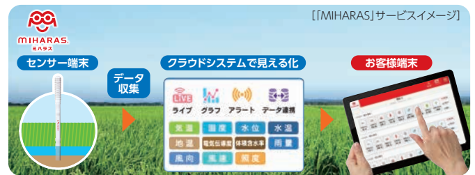
農業向けITセンサー「MIHARAS」

グループ会社のニシム電子工業㈱では、農業向けITセンサー「MIHARAS」を提供しており、同センサーの活用により、収集データをスマートフォンやタブレットで確認することが可能となるなど、農家の省力化を支援しています。