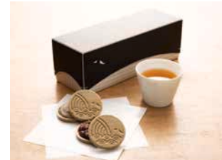
新たに開発した「くじら最中」(長崎県東彼杵町)

九州電力(株)は、継続的に地域の課題解決に貢献していくことを目的に、交流人口の拡大や関係人口の創出などをテーマとしたプロジェクトを地域の皆さまと進めています。2020年11月からは、長崎県東彼杵町で「東彼杵ひとことの公社」との協業により、「くじら最中」などの物産品の販売を開始したほか、交流拠点の整備も進めています。また、2021年4月からは、福岡県新宮町相島において「相島活性化協議会」と共同で、関係・定住人口の創出を目指した検討を行っています。