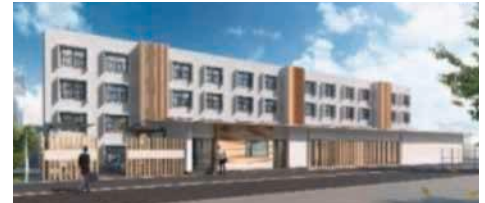
アスリート寮完成イメージ(2022年春入寮開始)

具体的な取組みの1つとして、県内企業8社と共同で新会社を設立し、当社施設(旧社宅)を活用した高校生アスリート寮の整備・運営に取り組んでいます。