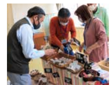
福祉事業者さまを応援する販売会の様子(佐賀県佐賀市)