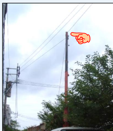
【クレーンが高圧線に接触】