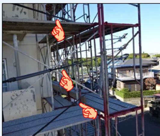
【足場が高圧線を貫通】