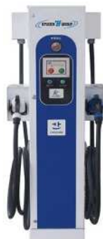
2プラグ 急速充電器