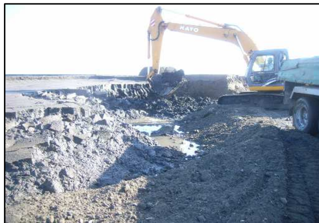
写真④ 土質不良箇所（例：港湾工事）