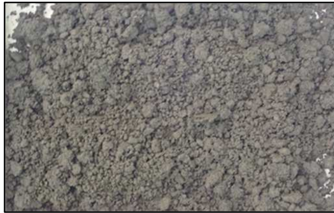
写真③ 脱水した一般的な土（土質改良後）