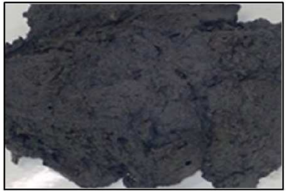
写真② 水を多く含んだ軟らかい土（土質改良前）