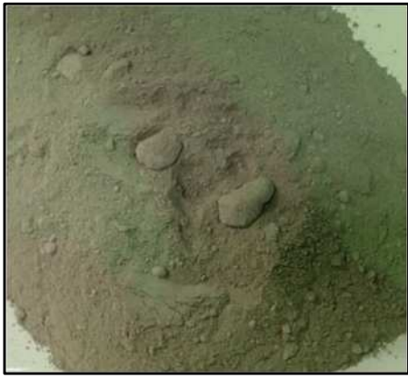
写真① 土質改良材（試作品）