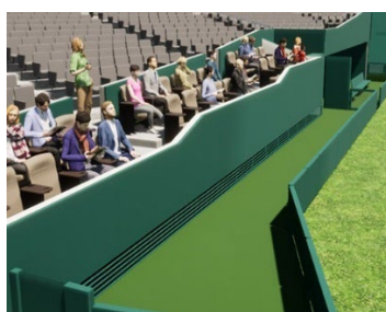
＜ダイヤモンドビューシート＞